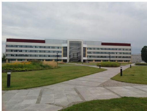
Az egyetem Biotechnológiai Intézete

11. Egy-két képet kérek, amely leginkább jellemzi az ösztöndíjas időszakot vagy fogadóintézményt és a külügyi honlapra és/vagy a falújságra kitehető.