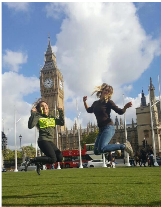
Londonban a SZIE-sek