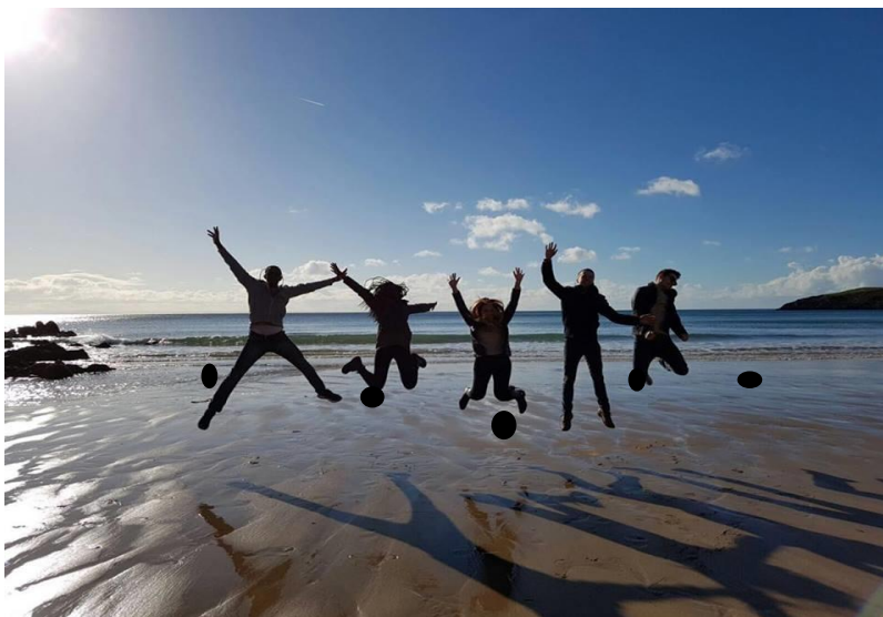
Kirándulás Walesbe a lakótársakkal - Swansea

11. Egy-két képet kérek, amely leginkább jellemzi az ösztöndíjas időszakot vagy fogadóintézményt és a külügyi honlapra és/vagy a falújságra kitehető.