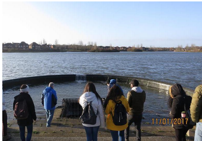
KÉP 1: Terepgyakorlat, Milton Keynes, UK

11. Egy-két képet kérek, amely leginkább jellemzi az ösztöndíjas időszakot vagy fogadóintézményt és a külügyi honlapra és/vagy a faliújságra kitehető.