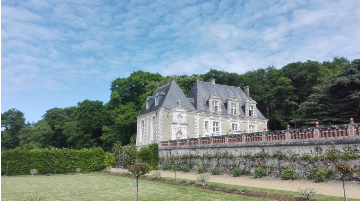
A kastély látványa a Léda teraszról