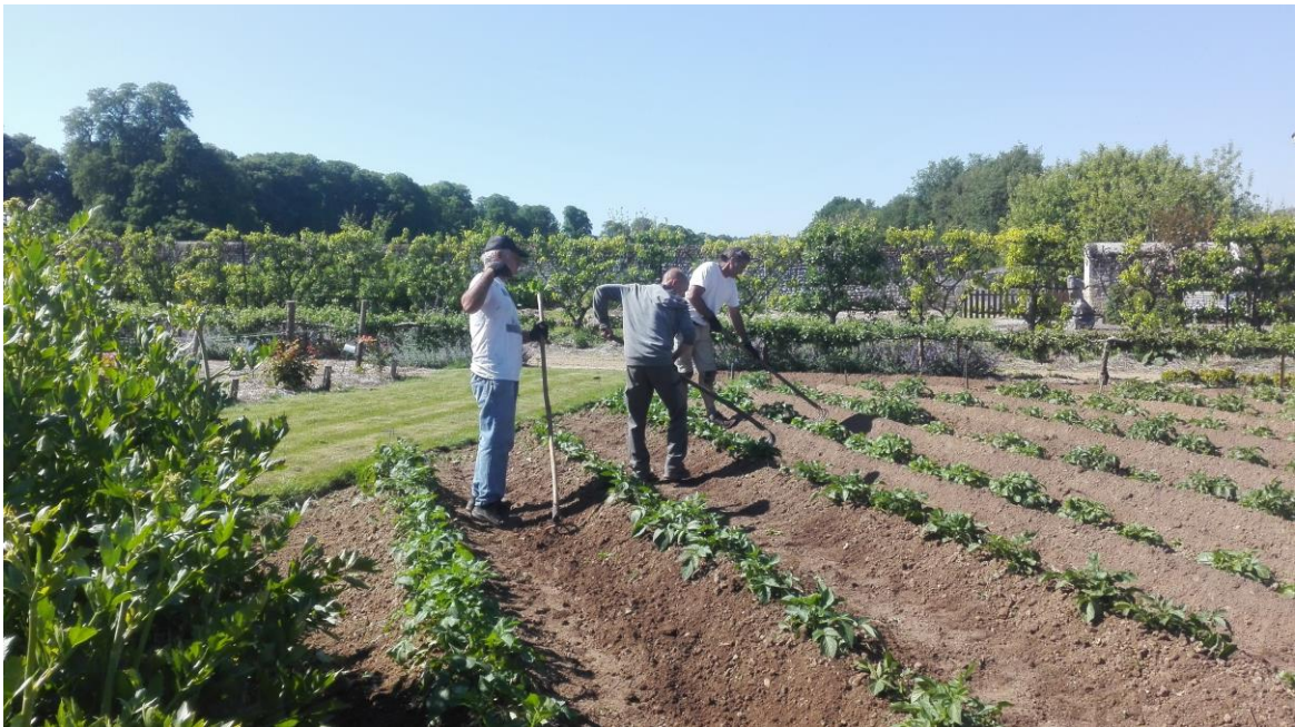
Munka a kertészekkel (burgonya gondozása)