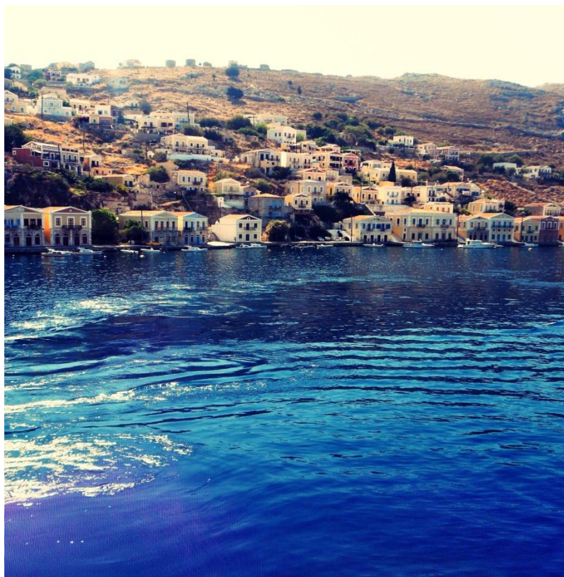
1. Simi Island