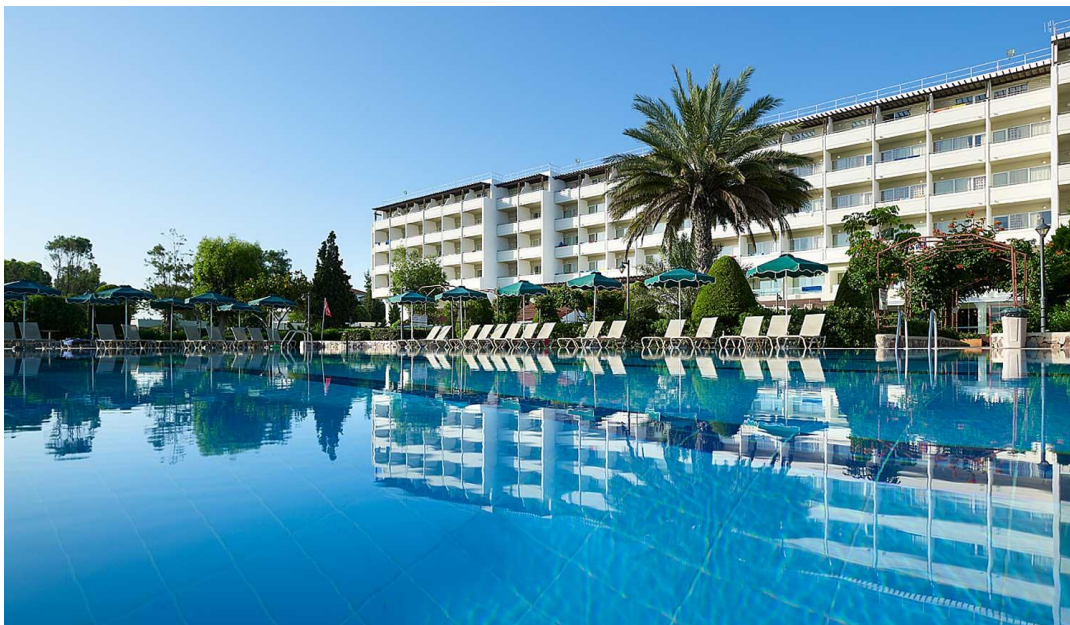
1. Blue Bay Hotel_Pool side

11. Egy-két kép, amely leginkább jellemzi az ösztöndíjas időszakot vagy fogadóintézményt és a külügyi honlapra és/vagy a faliújságra kitehető.