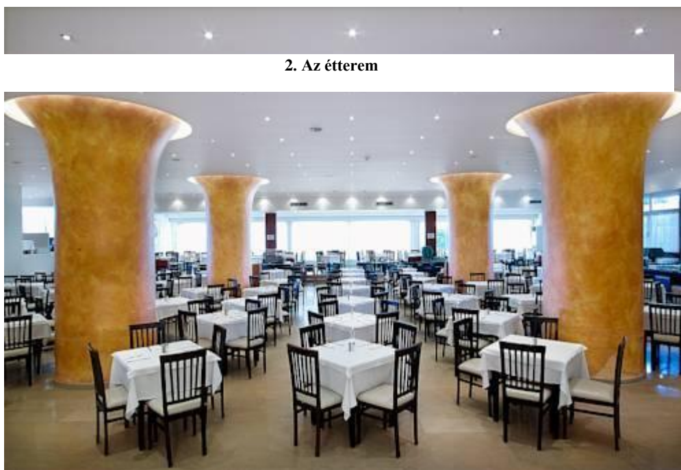
2. Az étterem