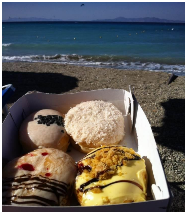
4. Napi rutin a parton