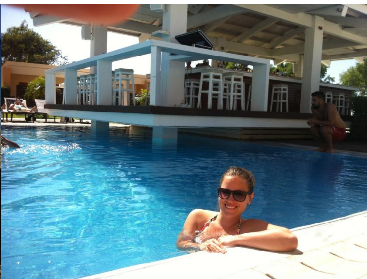
5. Villa di Mare_day off