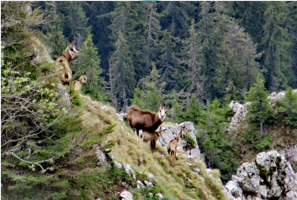
Zergék a Nagyhagymás alatt