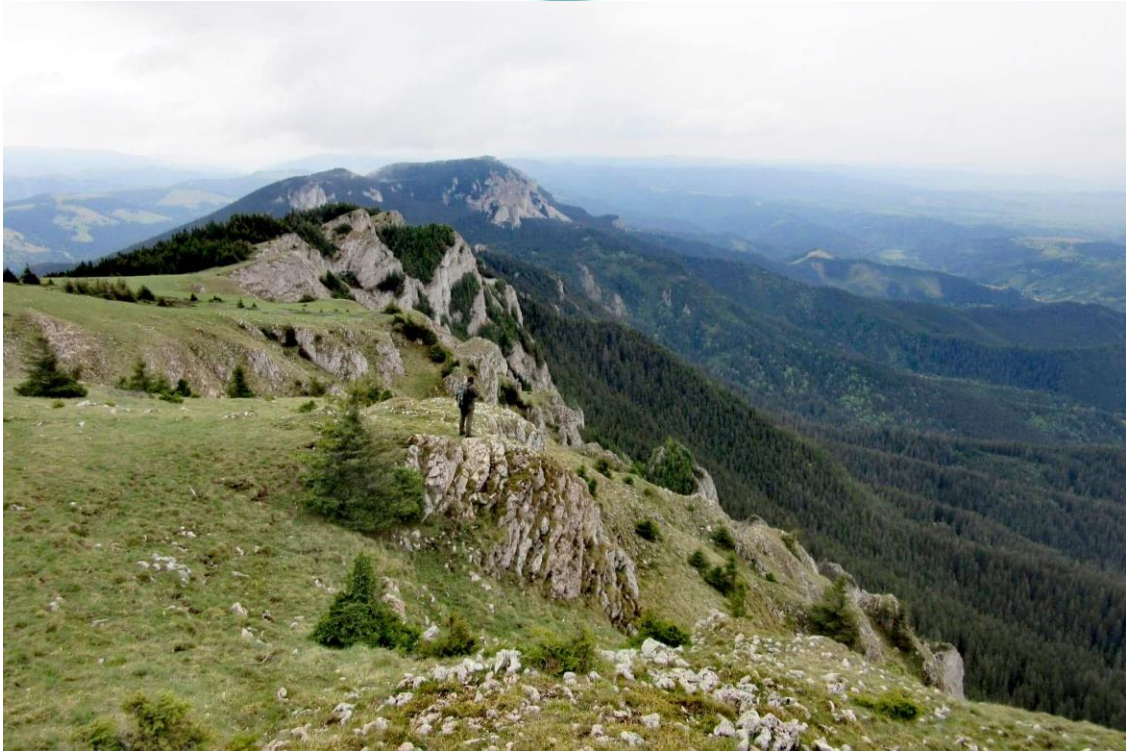
A Hagymás mészkő vonulata