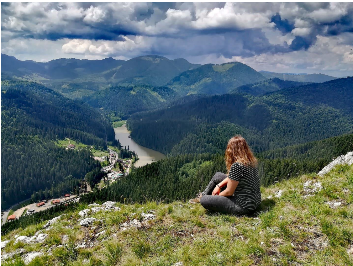
A Gyilkos-tó a Kis-Cohárd tetejéről