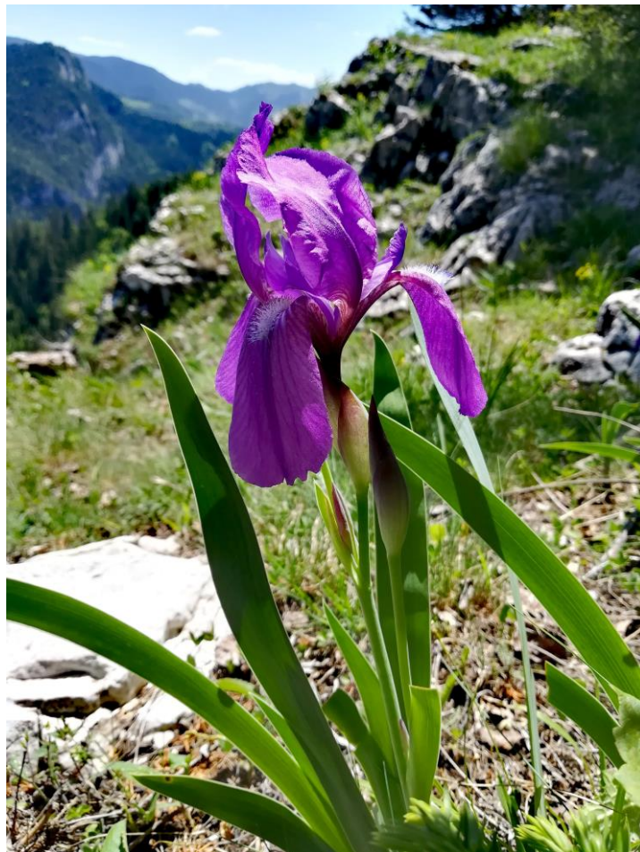
Magyar nőszirm a Tündérgyepben